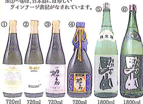
①~④は各担当営業までお問い合わせ下さい。